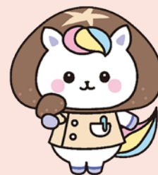
大分県 かんごちゃん