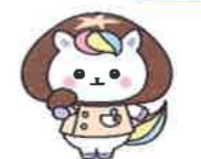
大分県かんごちゃん